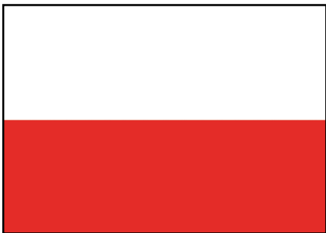
Flaga państwowa RP

Hierarchii tej należy przestrzegać na zewnątrz i wewnątrz budynków lub obiektów sportowych. Z wymienionymi flagami nie wolno eksponować flag reklamowych.