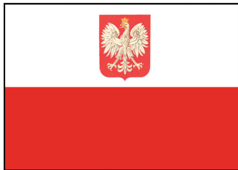
Flaga państwowa z godłem

Jeśli eksponuje się na masztach więcej flag, flagę państwową RP podnosi się (wciąga na maszt) jako pierwszą i opuszcza jako ostatnią.