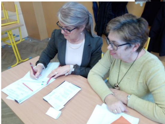
Hospitácia vedenia školy