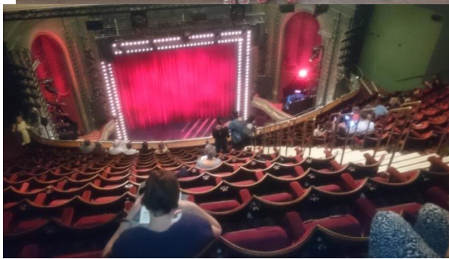
Návšteva Piccaly Theater