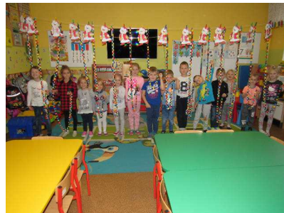
sala oddziału przedszkolnego.

Na zielonych terenach wokół szkoły znajdują się liczne obiekty sportowe: boisko do gry w piłkę nożną, boisko do gry w piłkę ręczną, boisko do gry w piłkę koszykową, boisko do gry w siatkówkę, bieżnia, skocznia i plac zabaw.