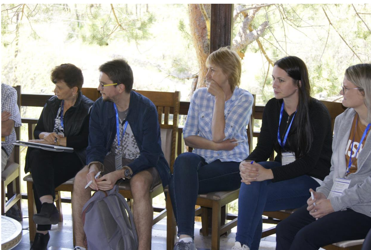
Aktivita s názvom Ako motivovať študentov?