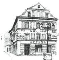
Kamienica „Pod Bykami”