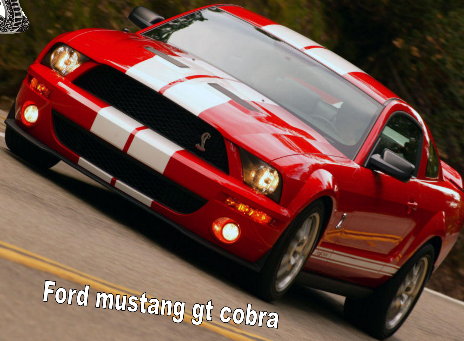
Ford mustang gt cobra