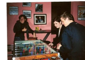
pri oblúbenej činnosti