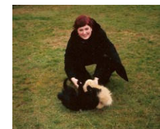
srdcové záležitosti (deti a psy)