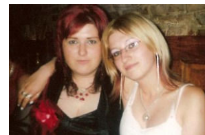
p. učiteľka so sestrou Ivkou