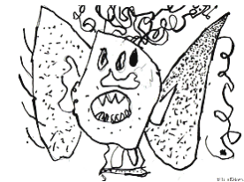
Filipko Fašiang, 2.S.