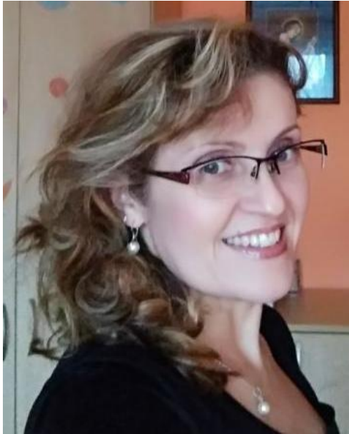
Vyučujem anglický jazyk a telesnú výchovu.