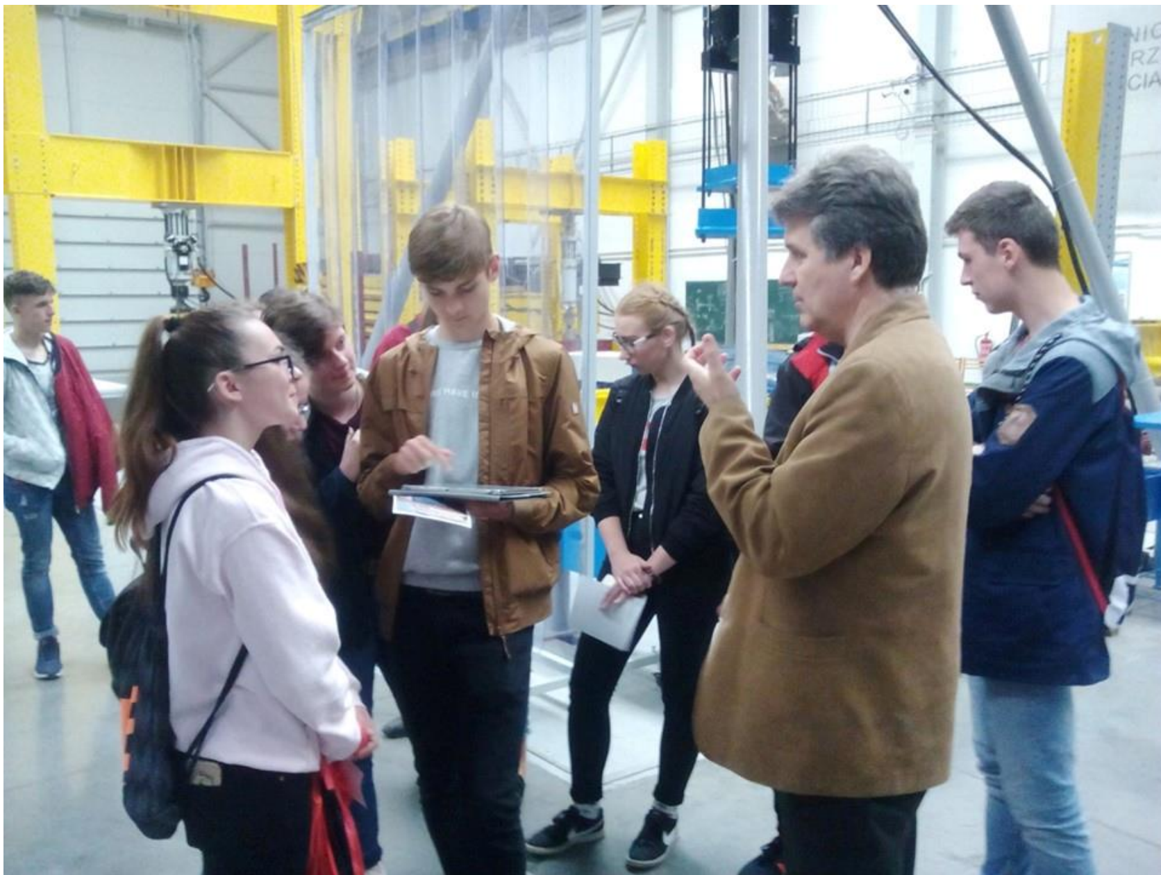
Prváci na podnetnej odbornej exkurzii