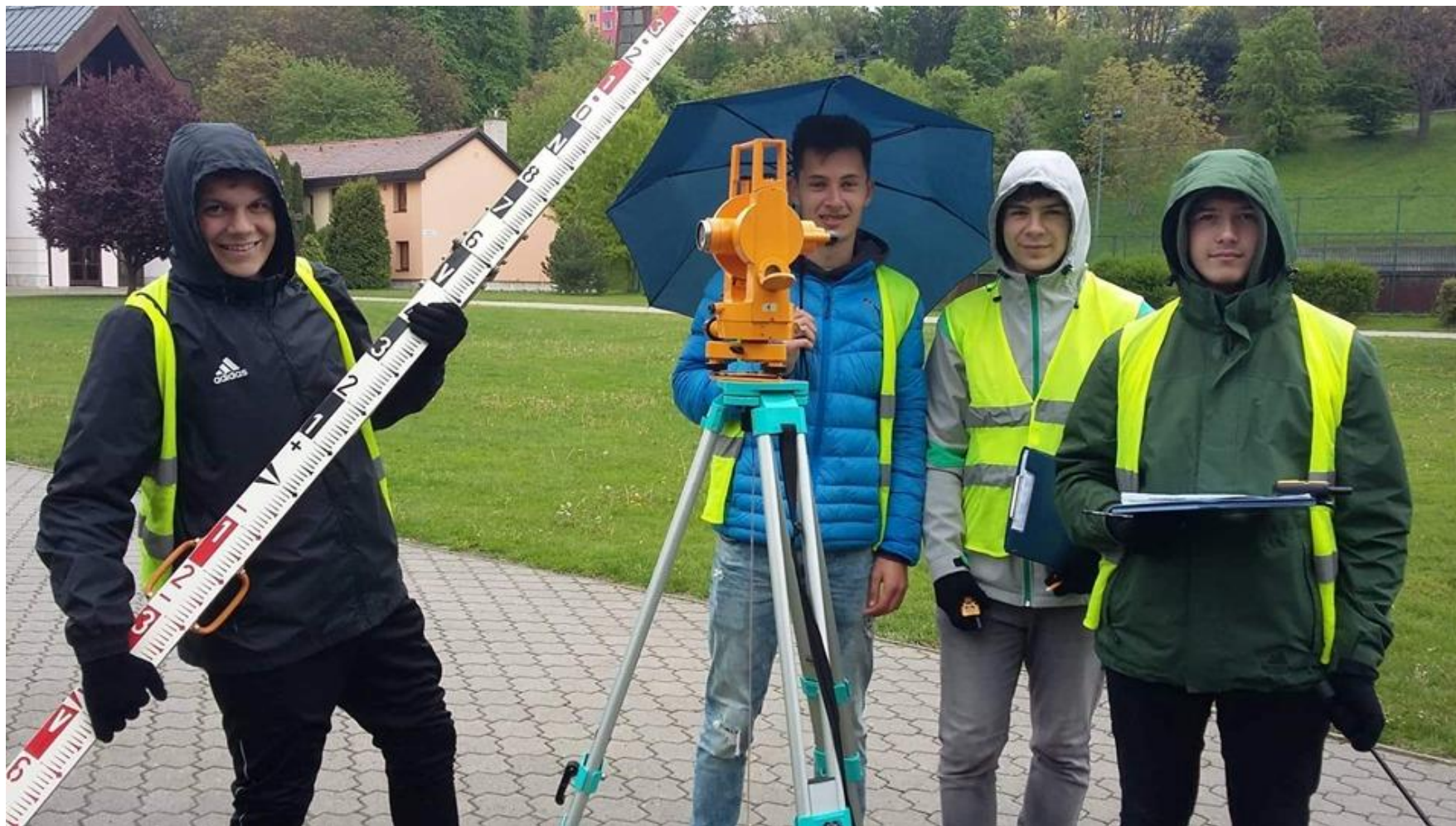
Druháci na súvislej praxi na Sekčove