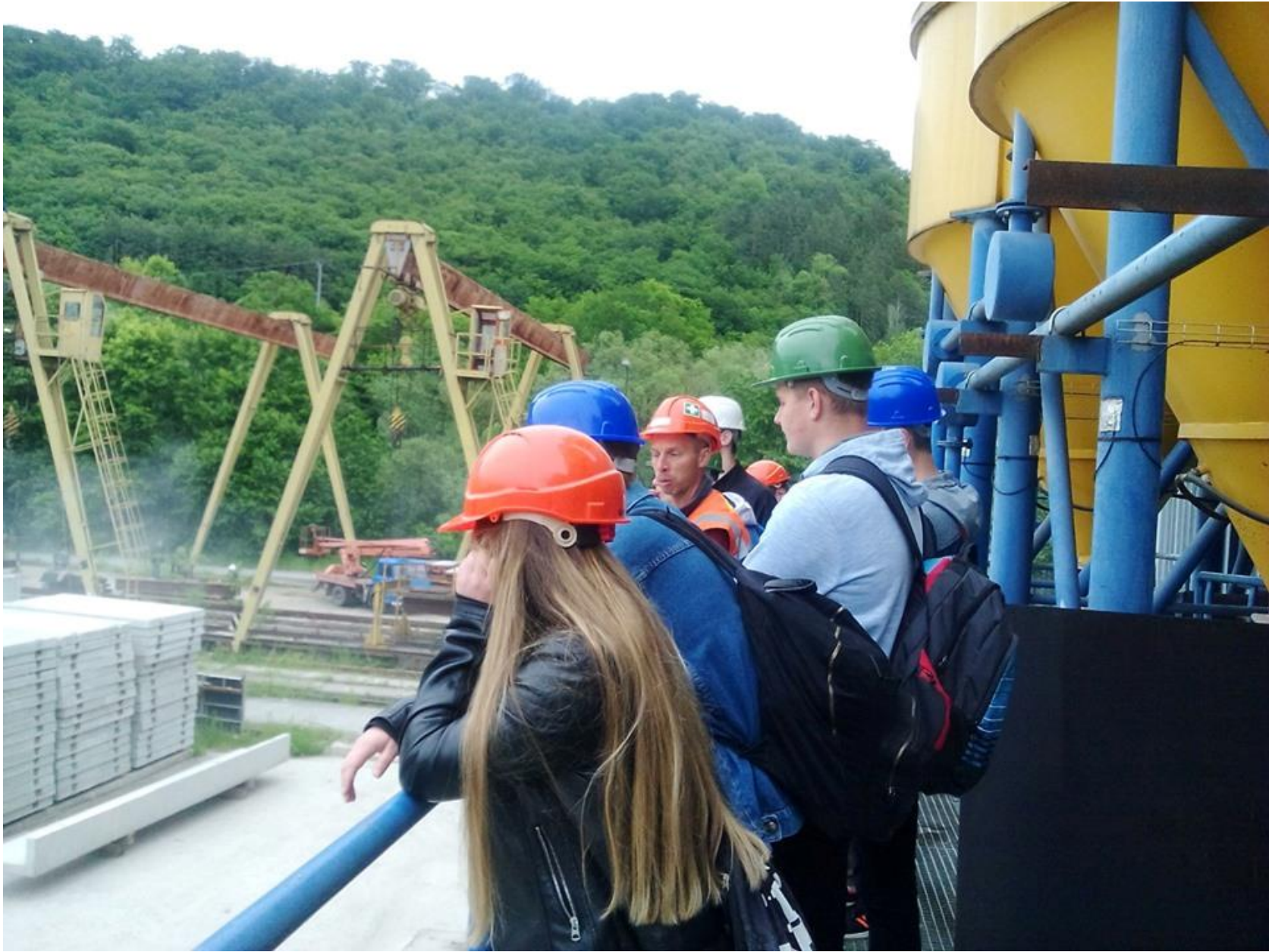
Prváci na odbornej exkurzii v Kysaku