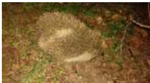
Nový bellamosák ☺ čakal neskoro večer pred budovou školy ☺