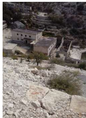
Ostrov Goli – politická väznica (1948-1988)