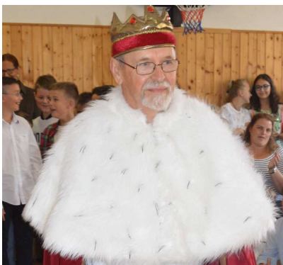
Kráľ Abecedár - prvý deň školského roka 2018/2019