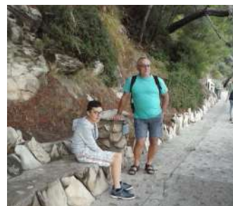
Chodník popri mori