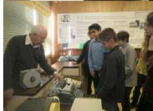
Siedmci pri počítači RPP - 16