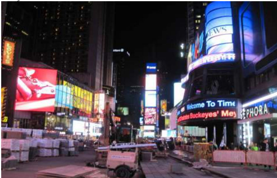
Rozkopaná Times Square