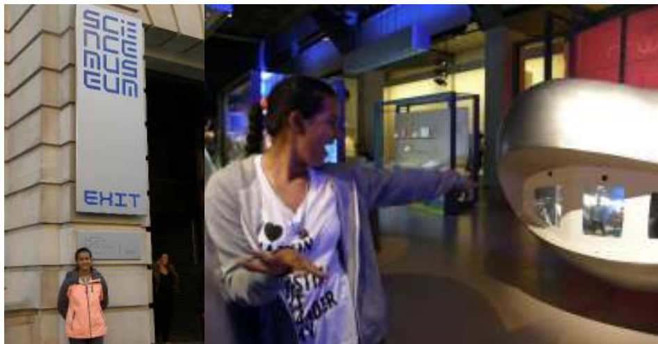
Obrázok 11 – vchod do Science Museum