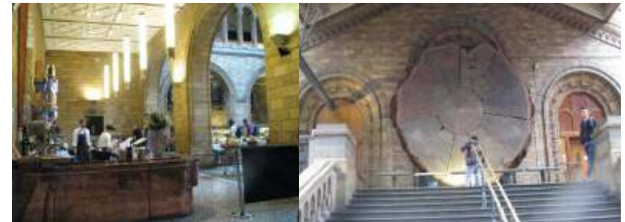
Obrázok 9 – Reštaurácia v Prírodovednom múzeu Obrázok 10 - Prierez stromu sekvoje

My sme v múzeu strávili niekoľko hodín, ale na jeho prehliadku treba určite aspoň jeden celý deň! Po prehliadke sa môžete občerstviť priamo v múzeu – dali sme si pizzu a bola O.K.