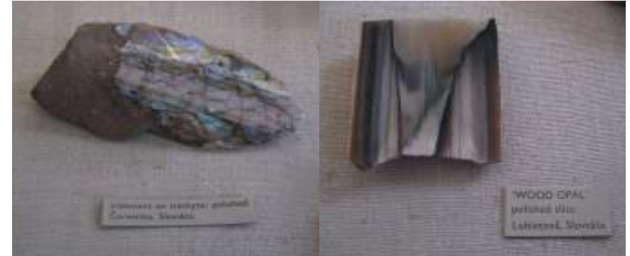
Obrázok 7 – Trachyt: Červenica, Slovakia Obrázok 8 – Opál: Lubietová, Slovakia

Už si viem predstaviť, čo by silnejšie zemetrasenie mohlo spôsobiť, koľko škody a akú neuveriteľnú má silu! V ďalšej časti boli rôzne nerasty a rudy, dokonca aj kameň z povrchu mesiaca. A kto hľadá – ten nájde. Aha, čo nájdete v Londýnskom múzeu? Steny popraskali, police s riadom sa zosunuli z poličiek a hoci to bola ukážka iba slabého zemetrasenia – bolo fascinujúce zažiť ho.