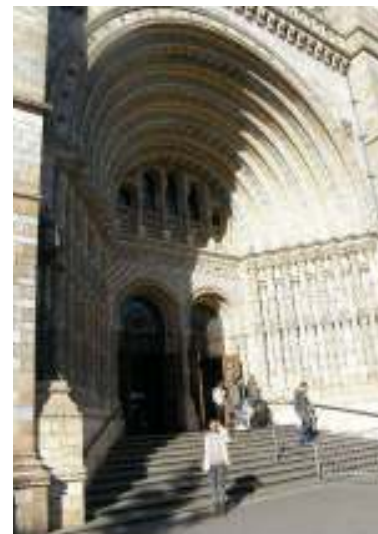
Obrázok 1 – Ja pred Prírodovedným múzeom

O Londýnskom múzeu som Vám už písala. Nevieť, či si spomínate. Veľký požiar, založenie Londína, krásne papučky a školáci, čo sedeli na taškách pri vytrínach a niečo prepisovali, alebo kreslili. Ďalší deň mamina nazvala: „Aj učenie môže byť zábava!“. Ved' áno, to môže, ale väčšinou sa zabávajú len učitelia. Tak trochu zabúdajú, že sme predsa len ešte maličky a radi veci skúšame, skúmame a vymýšľame. To, čo sa píše v knihách, je pre mnohých len dlhý text, napísaný v jazyku, ktorý nikto zatiaľ nerozlúštil. „Ved' je to jednoduché, no ukáž!“ vravia. Potom nasleduje ten podivný výraz, akože „Čože?“, zodvihnú obočie a začnú recitovať to, čo sa píše v knihe. No super, ved' ja viem čítať. Ale tomu nerozumiem. A učiť sa niečo, čomu nerozumiem, iba tak? Ved' nechodím do cirkusu, ale do školy, či? Vyrazili sme autobusom na stanicu Viktória a odtiaľ sme sa peši vybrali do Hyde Parku. Tam je vraj miesto, ktoré sa volá Speaker's Corner a každý si tam môže povedať, čo chce a čo si myslí. A aj som si povedala! Vraj kúsoček! Keby tak mohli moje topánky hovoriť, určite by sa na tom Corneri vyjadrili k rozdielom medzi kúsočkom a kusiskom! Konečne sme sa ocitli pred Prírodovedným múzeom, teda Natural History Museum.