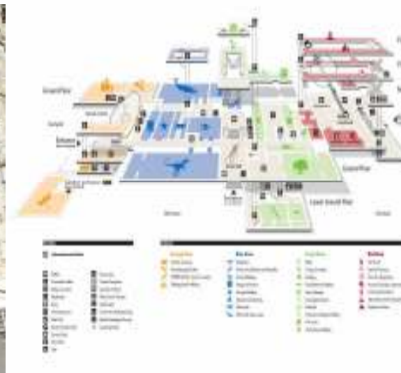
Obrázok 2 – Mapa múzea

Už len samotný vchod do múzea bol ohromný. Vyzeralo ako nejaký hrad, alebo sídlo bohatých. Akože prečo som bola tak mimo z niekoľkých oblúkov? No, konečne to nebola budova z červených tehál. Múzeum sa delí na štyri zóny podľa farieb – čo je super, teda to si zapamätá asi každý. Mne sa najviac páčila červená a modrá zóna. Červená ako sopky, láva a naša planéta Zem, modrá zóna ako ryby, plazy a podmorské živočíchy. Aké jednoduché. Vo vstupnej hale je veľká kostra diplodoka a navôkol stoja ako vo výkladoch pandy, medvede a iné vypchaté cicavce, takže som mala chvíľu pocit, akoby konečne prerobili múzeum A. Kmet' a v Martine. Až kým som nevidela toto! Obraz z kolibríkov!