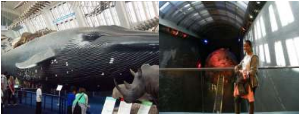
Obrázok 5 – Obrovská veľryba

Už to neboli len zvieratá, kostry a obrazy. Videla som vtáky, ktoré boli ako živé, také, ktoré boli ako umelé, potom vtáka bez peria natiiahnutého na škrípce a k tomu časti jeho telička a vnútornosti naložené v pohároch ako zavárané uhorky. Nechutné, ale husté! Z modrej zóny sa mi páčila veľryba. Jasné, že som vedela, že je to VEĽKÁ ryba, ale taká obrovská? Paráda. Veď aký veľký je v porovnaní s nami nosorožec a ten vedľa veľryby vyzerá ako rohatý hmyz.