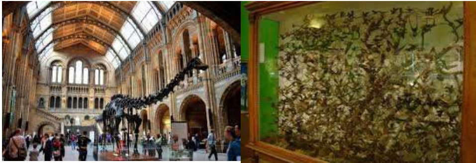
Obrázok 3 – Vstupná hala