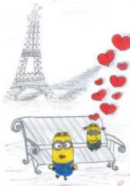
Autorka obrázku - Emka Dawelbeitová