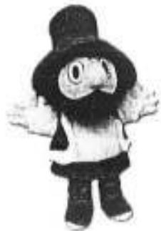
Rumcajs - rozprávková postavička, s ktorou sa možno niektorí z vás stretnú