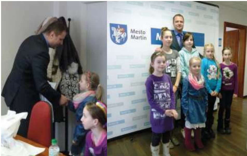
Sandruške srdečne blahoželáme!