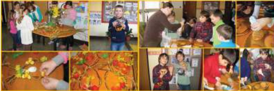
Aranžovanie venčekov z prútia. Precíznosť, ale aj voľnosť a maškrtný jazýček detí, ktoré cukrovou polevou skrúšľovali medovníkové vajíčka.