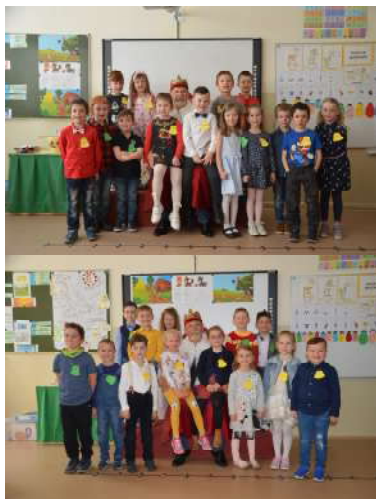
Zápis prvákov